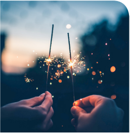
الرضا بين الزوجين.. غاية سامية