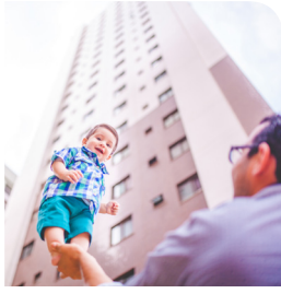
اساليب نافجة لتربية الصغار