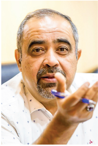
جمال الدين الشهرستاني