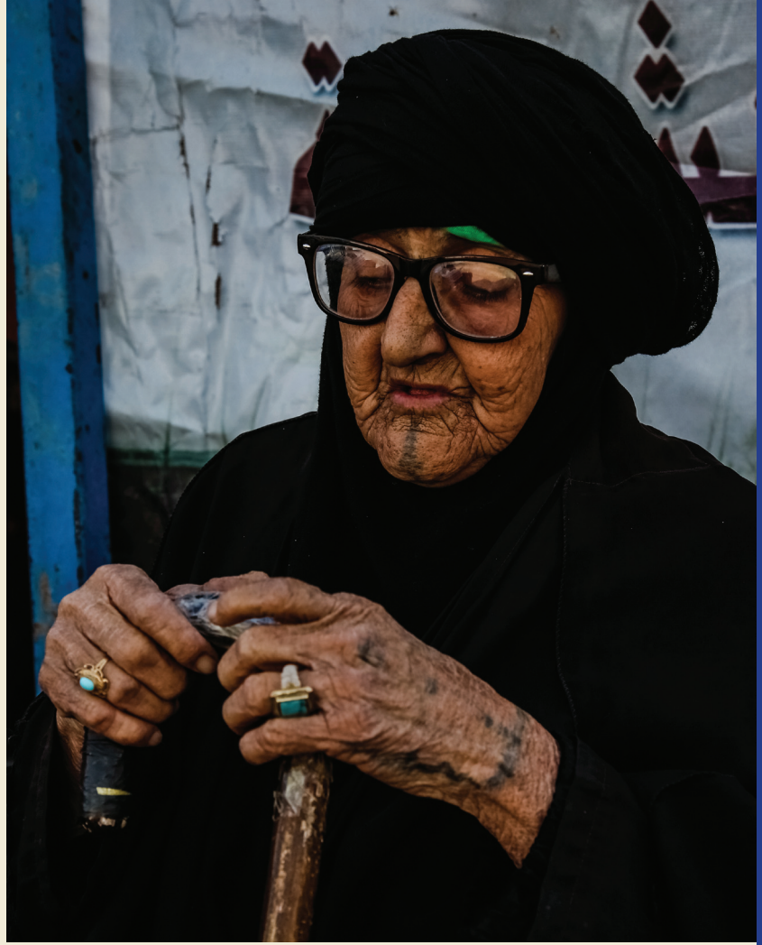
لعظمة انفاس رحمتك على المؤمنين تجلي التفكير والتسيب