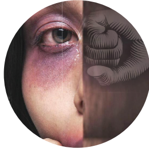
نساء.. تحت سطوة العنف الصامت