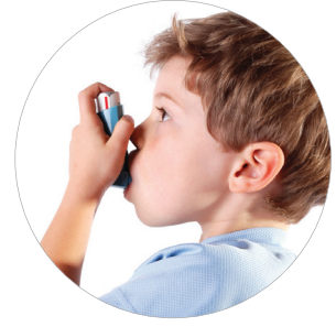
الربو.. حقائق وخرافات