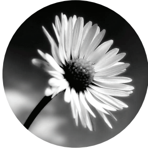
على باب الرسول