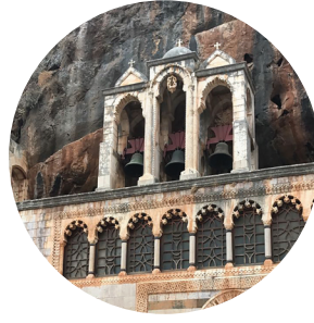
ثبات الايمان في عصور الظغيان وادي الرهبان المقدس